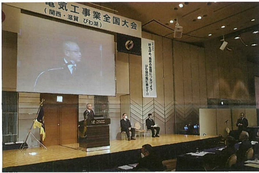
参加者と質疑応答