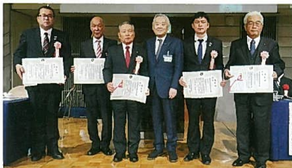
優良事業工組表彰の金・銀・銅受賞工組 (左から北海道、埼玉、新潟、米沢会長、島根、岩手)

優良事業工組表彰が行われ、金賞を受賞したのは新潟県の「10年先の未来を見据えた「新潟県工組タスクフォース」の発足」。銀賞は北海道青年部札幌支部、埼玉県、島根県、銅賞は岩手県が受賞。優良賞は広島県青年部、特別賞には山形県の酒田支部女性部、沖縄県中部支部が選ばれた。 金賞を受賞した新潟県と、青年部会員の優良活動発表で最優秀賞を獲得した北海道青年部「令和2年度北海道高等学校電気科教育研究会総会・研究協議会 電気工事技術講習会講師」の事業内容が大会参加者へ発表された。