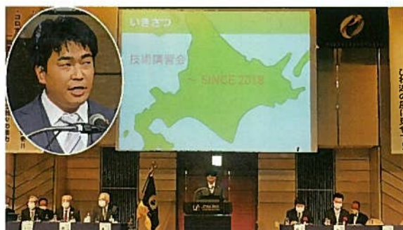
青年部の最優秀賞を受賞した北海道