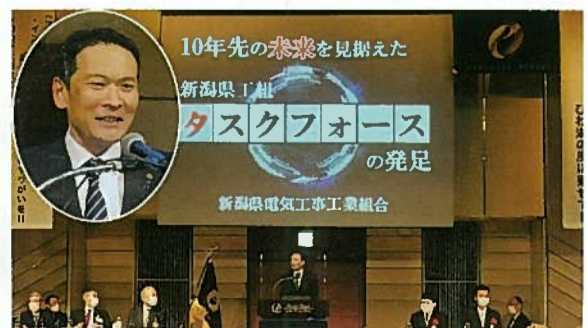
金賞を受賞した新潟県